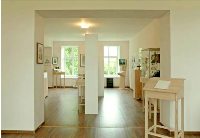
Die Ausstellungsräume befinden sich im Gemeindehaus der evang. luth. Kirche in Vilkyškiai

Die Dauerausstellung in Form eines kleinen Museums ist dem Dichter Schriftsteller Johannes Bobrowski gewidmet. In vielen seiner Gedichte und Erzählungen, seiner Romane, findet die Landschaft um Willkischken, dem heutigen Vilkyškiai Erwähnung. Es ist die Landschaft seiner Kindheit, eine „Landschaft mit Leuten“, wie Bobrowski schreibt. Das heutige Vilkyškiai liegt in Litauen, nahe der russischen Grenze, der Oblast Kaliningrad.