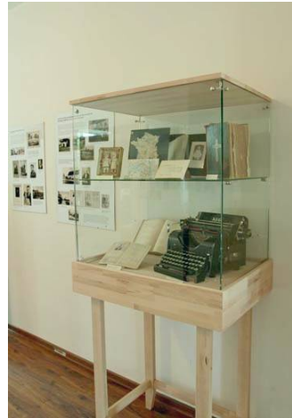
Vitrine mit Originalexponaten aus dem Besitz von Johannes Bobrowski