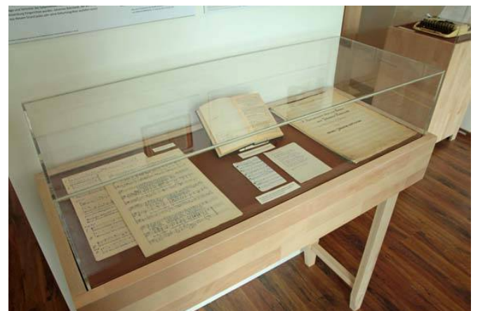
Handgeschriebene Noten und Seiten aus dem Notizbuch Bobrowskis